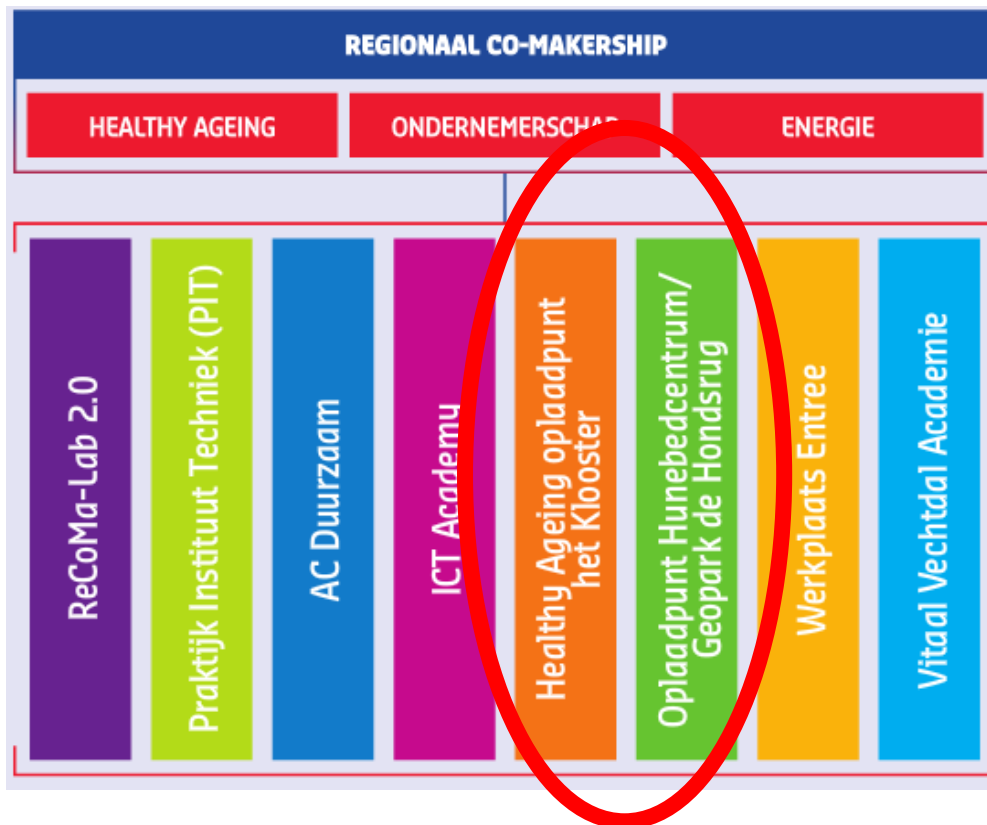
Afbeelding 1, de 8 deelprojecten van de RIF

Inhoudelijke beschrijving over de inhoud van het project RIF en de tijdslijn → zie Koers, Magazine over Regionaal co-makership (oktober,2015) en RIF aanvraag, (2015).