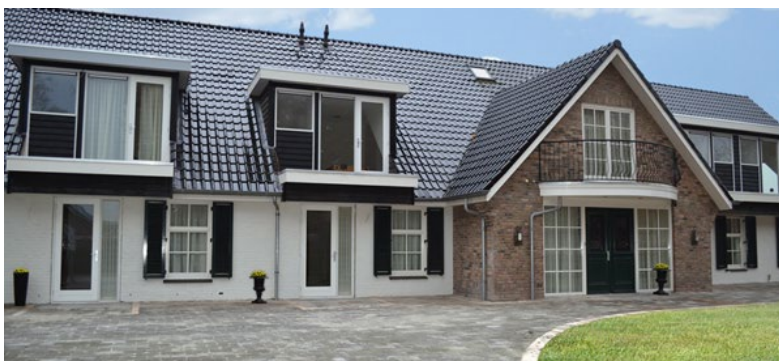
Afbeelding 1 overgenomen uit www.dezorgvilla.nl

In Veenoord is vervolgens een kleinschalige, particuliere woonzorgvoorziening opgericht waar gecombineerde verpleeghuiszorg wordt gegeven aan mensen met een somatische en/of psychogeriatrische zorgvraag met 24/7 zorggarantie. Dit is de Zorgvilla sinds 2014, zie Afbeelding 1. Vanuit deze filosofie is er een leerwerkplaats in samenwerking met het lectoraat opgezet.